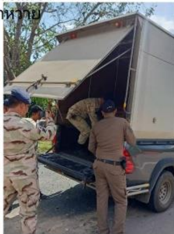
สภ.นาหวาย