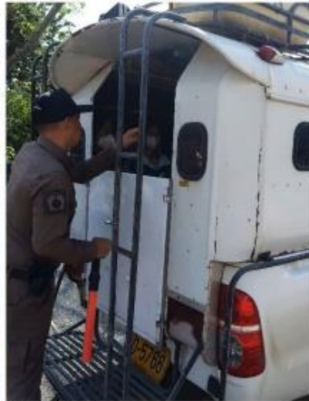
ด้านตรวจแม่จา